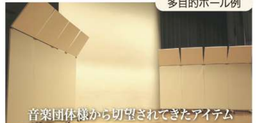
音楽団体様から切望されてきたアイテム