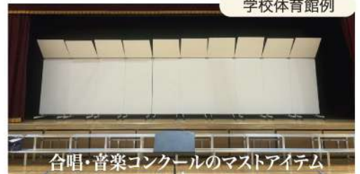
合唱・音楽コンクールのマストアイテム