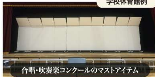
合唱・吹奏楽コンクールのマストアイテム