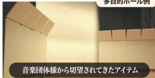
音楽団体様から切望されてきたアイテム